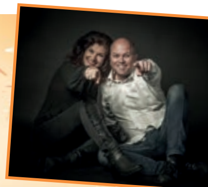
Duo Double zorgt voor de muzikale omlijsting.

Lekker bijpraten, meezingen en dansen! Een sfeervolle Koningsnacht zoals we die al jaren kennen in het dorp. We nodigen iedereen uit om te komen en zich uit te dossen in het oranje/rood-wit-blauw voor het echte Koningsnachtgevoel! De entree is gratis.